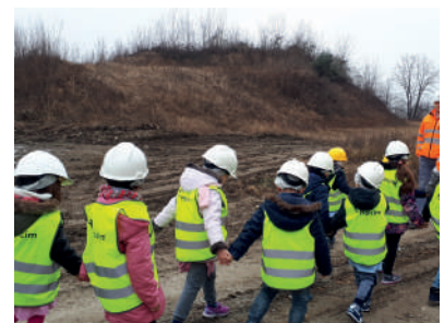
Cemento, un mondo tutto da scoprire