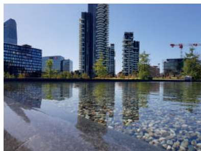
Le torri di Milano vestono calcestruzzo Holcim