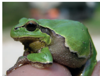
Rafforziamo la Biodiversità